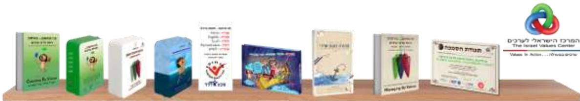
מפת חוסן: צד אחד מפת הלחצים

אימון על פי ערכים / ספר עיון ----- 64 עמ' (במקום 84 עמ' בחנויות)