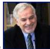
פרופ' שמעון דולן